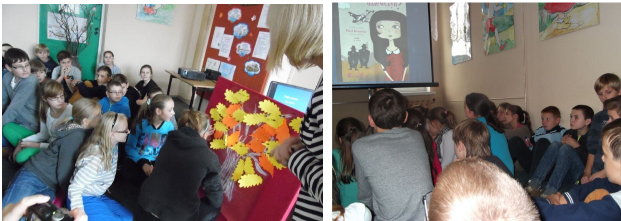
Uczniowie ze Szkoły Podstawowej w Giewartowie

Spotkanie rozpoczęło się od poznania zainteresowań czytelniczych uczestników. W tym celu uczniowie wzięli udział w zabawie aktywizującej zatytułowanej „Drzewo książek”, dzięki której poznaliśmy tytuły najchętniej czytanej przez nich literatury.